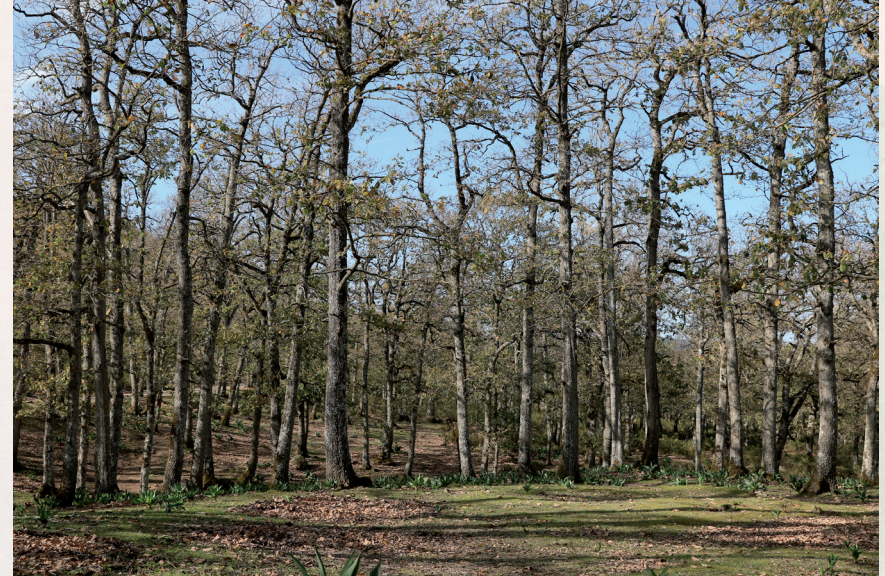
Forêt de chênes zéen surpaturée

Même si les pays ont montré un engagement théorique en faveur de l'adaptation fondée sur les écosystèmes, il est difficile que cet engagement se traduise par des objectifs clairs ou de savoir si les objectifs fixés seront suffisants pour répondre aux besoins d'adaptation des communautés et des écosystèmes concernés.