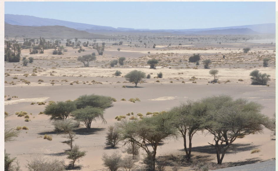
Plaine de Maider, Maroc

La partie sahélienne est caractérisée par une topographie relativement plate avec des montagnes disséminées dans certaines zones. Elle est située dans la zone climatique chaude de la planète, avec des saisons sèches et humides autour des tropiques du Cancer. Les pays sahéliens sont largement dominés par des milieux arides, semi-arides et subhumides secs qui se