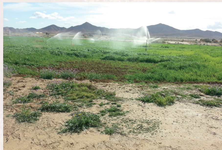
Cultures céréalières irriguées

Au Sahel , les projections du changement climatique prévoient une augmentation de 3 à 6 °C des températures moyennes d'ici à 2100 (RCP 8.5), avec une hausse de 3°C dans les zones côtières (Mauritanie) et de 4 °C dans la région sahélienne (Burkina Faso, Mali, Niger, Tchad). Une augmentation de la variabilité interannuelle des précipitations est également prévue, ce qui peut entraîner des oscillations abruptes entre des années très humides et très sèches (USAID, 2017). Les périodes de sécheresse ont été particulièrement difficiles dans les années 1910, 1940 et de 1968 à 1993 (Descroix et Lambert, 2018). Des inondations importantes ont, par ailleurs, touché plusieurs villes de la région, dont Ouagadougou en 2009, Dakar en 2012, Bamako en 2013 et Niamey à plusieurs reprises (en 2004, 2010, 2012, 2013 et 2016).